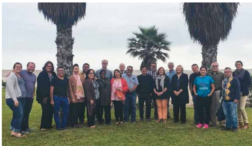
Groupe communautaire 2016 de LLB Amérique latine