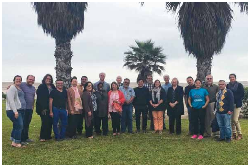
Grupo nuclear UB América Latina 2016