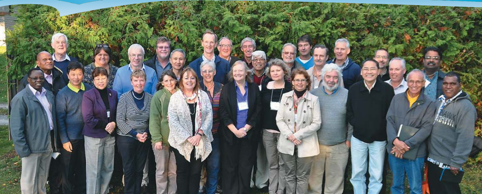
Consejo Internacional de UB en Jackson's Point 2014