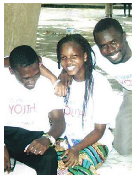
Campamento juvenil internacional en Gambia

hubo arranques como en los días anteriores. Compartieron el evangelio y el corazón de este niño herido respondió no con violencia sino con gozo, abrazos y calidez. El conocer a Jesús a través de las palabras de la Biblia y las acciones de los líderes que demostraron amor incondicional marcaron una verdadera diferencia. Nos recuerda nuevamente la hermosura de la responsabilidad humana trabajando de la mano de la soberanía divina para edificar el Reino, trayendo a las personas una por una.