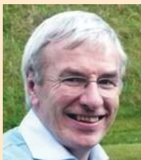
Colin Sinclair Presidente del Consejo Internacional UB

No conocemos a ciencia cierta ni nuestro destino final ni la velocidad a la que avanzaremos. Pero sí conocemos el rumbo que creemos es el correcto si hemos de cumplir nuestra visión de alcanzar a la siguiente generación y asegurar una interacción significativa con la Biblia. El espíritu que nació en el proceso de Esperanza Viva estuvo presente en nuestras conversaciones y nos alentó hacia la interdependencia y la colaboración. Les invitamos a que viajen con nosotros en la obra que hacen en sus movimientos nacionales, en el apoyo que brindan para la obra en otros países, y en sus oraciones por el ministerio en los años venideros.