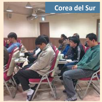
Corea del Sur